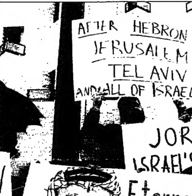
متظاهرون اسرائيليون يتظاهرون خارج فندق توقيف المفاوضات الخليل